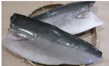
ブリフィーレ (冷凍)

【原材料名】：赤魚 (アメリカ産)・食塩 【規格】：4kg×3合 (16枚) 【荷姿】：発泡スチロール