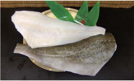
汐タラフ (チルド品)

【原材料名】：真鱈 (アメリカ産) 【規格】：5kg×2合 (5kg/5~7枚) 3kg×3合 (3kg/3~5枚) 【荷姿】：発泡スチロール