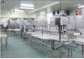
二段式整形コンベア

下の段より処理された魚を流し、最終整形し上の段のコンベアより次の作業工程に送ります。