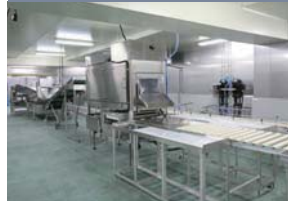
水圧ウロコ取り機

水圧のシャワーを使い魚のウロコと取ります。カレイ類はもとより赤魚などの色物でも、水圧を調整する事によりダメージ無く、綺麗にウロコを取る事が可能です。