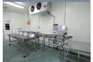
金属探知機付オートチェッカー

凍結された製品を金属探知機を通し、5種類の重量設定されたポケットに自動的に流します。重量設定は1g単位で可能です。