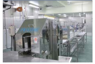
センターカット機

水圧のシャワーを使い魚のウロコと取ります。カレイ類はもとより赤魚などの色物でも、水圧を調整する事によりダメージ無く、綺麗にウロコを取る事が可能です。