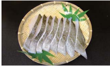
汐タラ切身 (チルド品)

【原材料名】：真鱈 (アメリカ産)・食塩 【規格】：70g 50入×3合 60g 30入×3合 【荷姿】：発泡スチロール