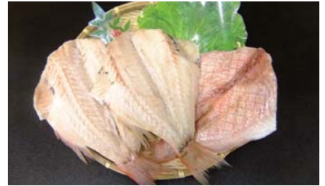
赤魚開き干し (冷凍)

【原材料名】：赤魚 (アメリカ産)・食塩 【規格】：5kg×2合 (16・18・20枚) 【荷姿】：発泡スチロール