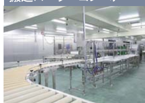
搬送ローラーコンベア