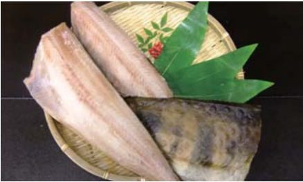
ホッケセンターカット干し (冷凍)

【原材料名】：縞ホッケ (ロシア産)・食塩 【規格】：5kg×2合 (20・22枚) 【荷姿】：発泡スチロール