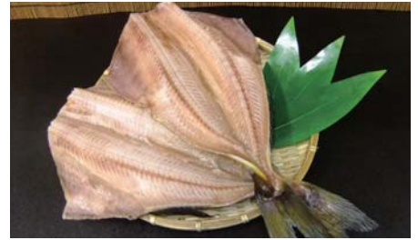
ホッケ開き干し (冷凍)

【原材料名】：縞ホッケ (ロシア産)・食塩 【規格】：5kg×2合 (14・16枚) 【荷姿】：発泡スチロール