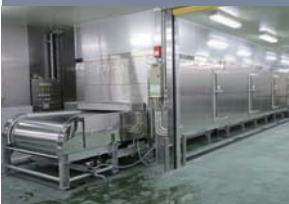
トンネルフリーザー

高性能トンネルフリーザーです。-40℃まで冷やし込み可能で、14mかけて急速に凍結していきます。1時間に500kgの凍結も可能です。