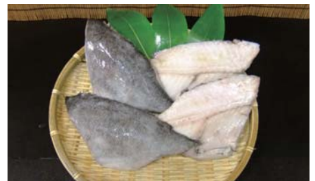
ツボダイセンターカット (冷凍)

【原材料名】：クサカリツボダイ (宮城県) 【規格】5kg×2合 (30枚) 【荷姿】：発泡スチロール