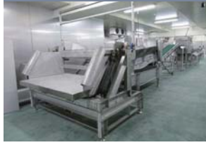
タンク上げ機、搬送コンベア

解凍後、タンクを上げ機に移動し、水を切り搬送コンベアにて原料を水圧ウロコ取り機へ送ります。