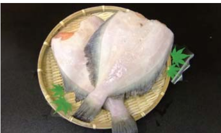
浅羽カレイ子持ち IQF (冷凍品) 中国加工

【原材料名】：浅羽カレイ子持 (アメリカ産) 【規格】：5kg×2合 8枚~20枚 (2枚きざみ) 【荷姿】：ダンボール