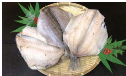
ツボダイ開き干し (冷凍)

【原材料名】：クサカリツボダイ (宮城県)・食塩 【規格】：5kg×2合 (20・25枚) 【荷姿】：発泡スチロール