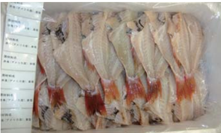
一汐赤魚開き (冷凍)

【原材料名】：赤魚 (アメリカ産)・食塩 【規格】：4kg×3合 (16枚) 【荷姿】：発泡スチロール