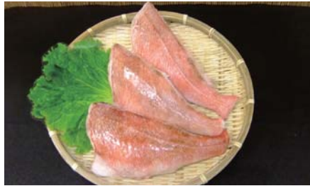
赤魚センターカット (冷凍)

【原材料名】：赤魚 (アメリカ産) 【規格】：5kg×2合 (25・30・35・40枚) 【荷姿】：発泡スチロール